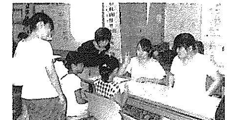
子供達も手話体験! 自己紹介の方法を教えてくださいました。

8月3日(日) 根上総合文化会館にて、連日の猛暑を吹き飛ばすような熱気があられる中、1,000人を超える方々をお迎えし、盛大に能美市社会福祉大会と能美市民ボランティアフェスティバルが行われました。お子様連れのご家族も多く来場され、『地域をよくするための色々な活動を見たり、体験することができて、楽しみながら理解することができました。』等のコメントが寄せられました。