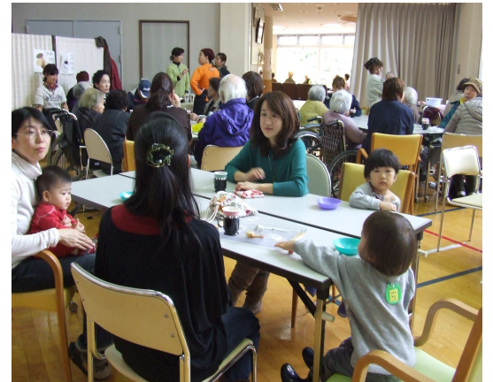
親子づれや近所の施設のみなさん方で賑わいました!

今後も、毎月、第3火曜日、10時~14時、辰口健康福祉センターにて行います。子育てに悩んでいるお母さん方も、”いっぴく”しにきてください。ボランティアの打ち合わせにもぜひどうぞ、どなたでもお集まりください!