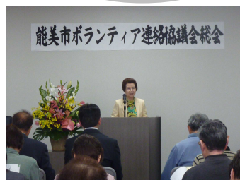
昨年度の総会の様子