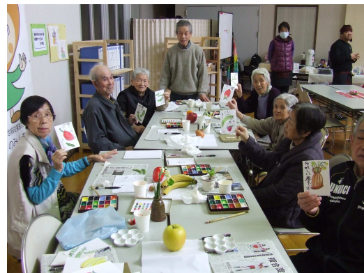
2月は絵手紙作成を体験しました!!